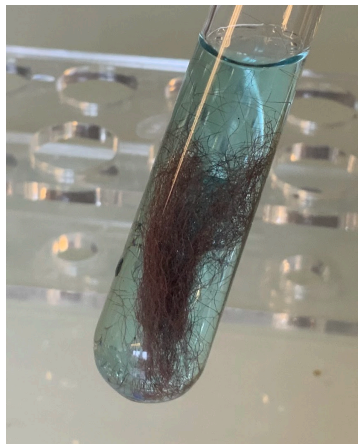
Photo 1 : Quelques secondes après introduction de la paille de fer dans la solution de sulfate de cuivre. On observe un dépôt rougeâtre sur la paille de fer.